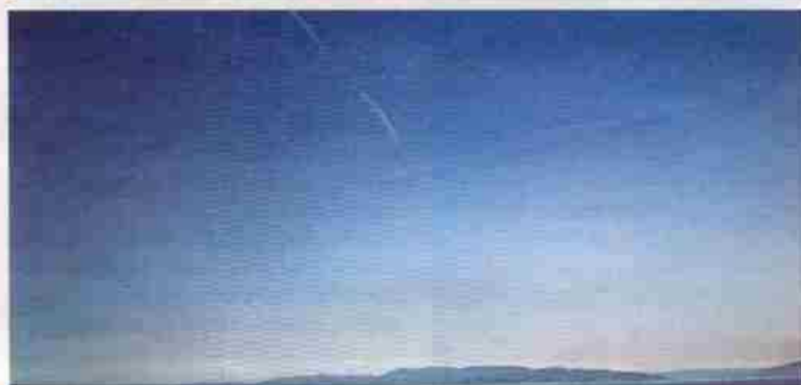
Des traces qui s'arrêtent net: mais où est passé l'avion? Ces photos prises en Louisiane (en haut) et en Croatie prouvent bien que toutes les traînées observées dans le ciel ne sont pas nécessairement liées à la propulsion des jets.

conclure que dans les jours et les semaines suivant une dispersion massive, on constaterait une intensification de certains symptômes: difficultés respiratoires, étouffement, crises d'asthme, maux de tête, troubles d'équilibre, fatigue chronique.