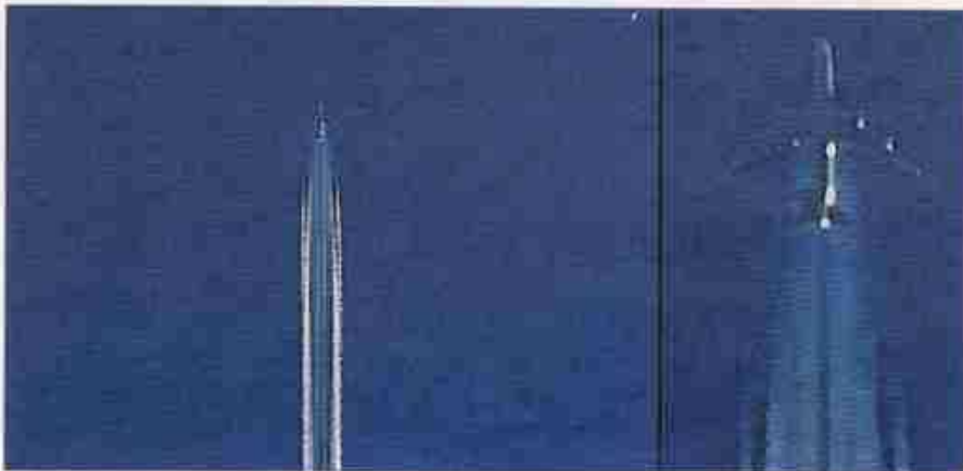
Ontario, octobre 2004: un avion-citerne KC-135 photographié en train de pulvériser des agents chimiques.

envisageait des conséquences sanitaires gravissimes, comprenant la mort éventuelle de quelque 40 millions de personnes par an. Particulièrement menacés seraient les enfants, les personnes âgées ou affaiblies ainsi que les personnes souffrant de maladies respiratoires. Du fait que le projet, selon Deep Shield, était conçu pour une durée de 50 ans, il fallait donc prévoir au total quelque 2 milliards de victimes.