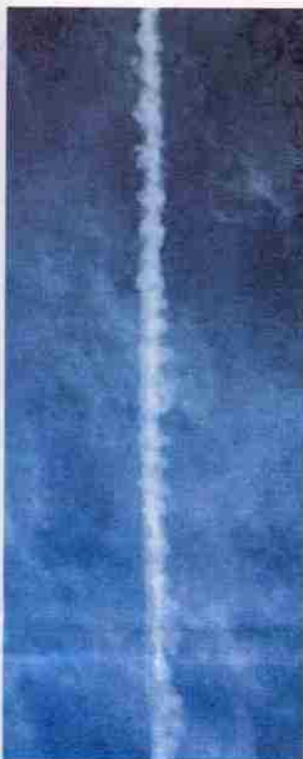
Rijeka, Croatie; 27 mai 2000 (ci-dessus), et Bossier, Louisiane: des traînées chimiques aisément identifiables par leur forme en «collier de perles». (Source: www.deepspace4.com).