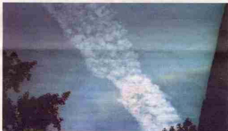
Bossier, Louisiane, 14 octobre 2000. Sur cette photo prise par Joanne Meehan, la brume chimique est si dense que des arcs-en-ciel chimiques («chembows») se forment dans le ciel. (Source: www.deepspace4.com )

Cette lettre s’accompagnait justement d’un extrait du rapport de l’IPCC: Climate Change 2001: Mitigation , qui nous avait offert un assez bon aperçu de ce qui mijotait déjà. Nous savons désormais que ce rapport se recoupe aussi bien avec les informations fournies par Deep Shield que par celles de Jim Phelps,