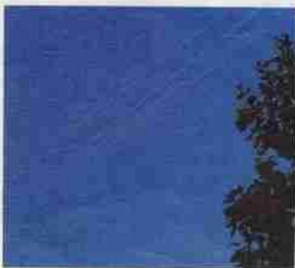
Paris, 8 septembre 2004, 12 h 15: depuis quand les avions de ligne volent-ils en formation serrée?

Député démocrate au Congrès américain et candidat putatif aux présidentielles 2004, Dennis Kucinich, était l'initiateur du "Space Preservation Act 2001", qui exigeait du Congrès une interdiction générale du déploiement de systèmes d'armements dans l'espace (10). Dans le cadre de ses recherches préparatoires, Kucinich avait pu avoir un aperçu assez approfondi des documents secrets de l'U.S. Air Force — si bien que sa motion mentionne explicitement les chemtrails parmi ces systèmes d'armements illégaux. Lors d'une audience publique à Santa Cruz (Californie), en juin 2003, Kucinich confirma une fois de plus l'existence et l'emploi effectif de l'arme climatique: